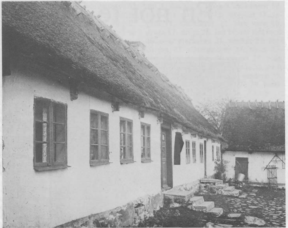
Rörum nr 8, stuglängans gårdsvägg, 1928.