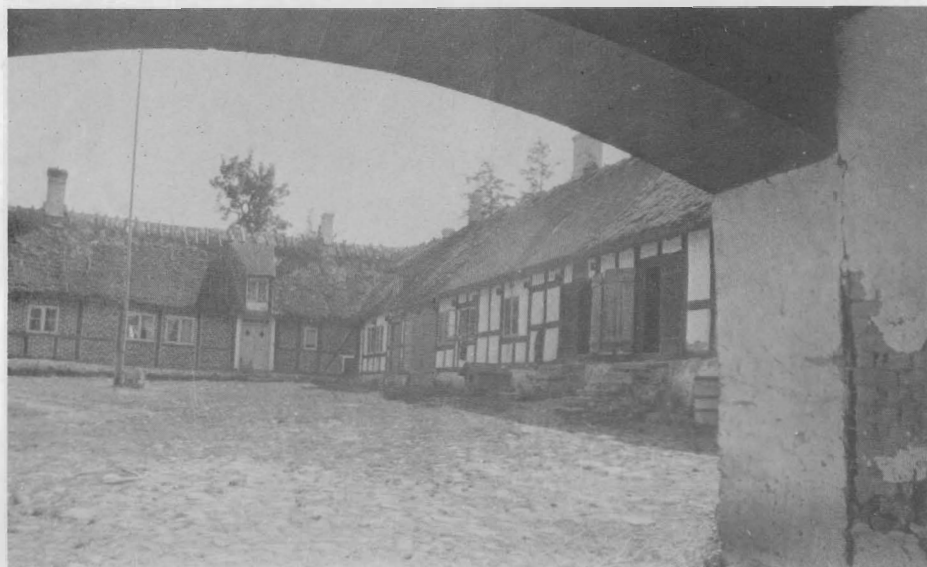
Rörum nr 27, gårdsinteriör, från sydväst från inkörspporten, 1927.