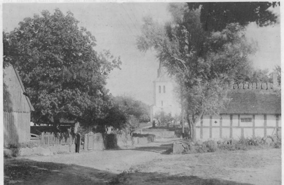
Norra infarten, 1927.

Folklivsarkivets fotoarkiv, Lund Luf Acc nr 6811, Folklivsarkivet, Lund Landsarkivet, Lund Husförhörslängder, Rörums socken Dop och dödboken, Rörums socken Albo häradsrätts dombok 1895