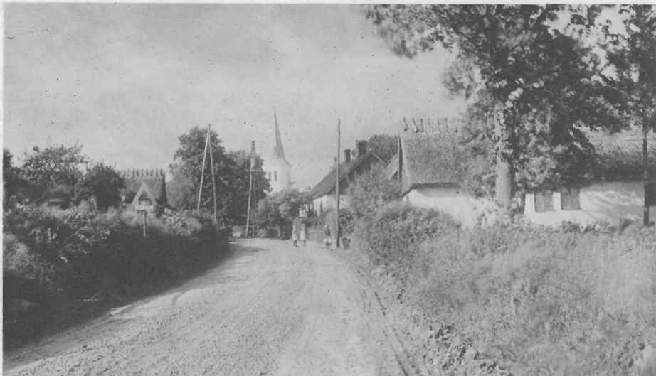
Östra infarten, 1928.

varande krögaren hörde till de som klarade sig, kan man lätt förstå. De hade bokstavligt talat sutit upp både hus och lösöre. Vad denna katastrof betydde för Rörum, visar den här nedanstående tragiska händelse, utspelad kort före kraschen: