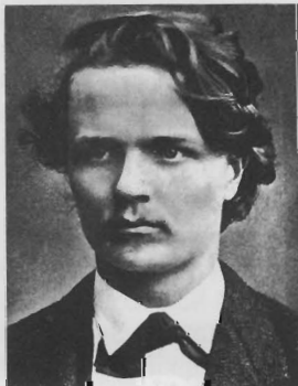
Strindberg i april 1875.