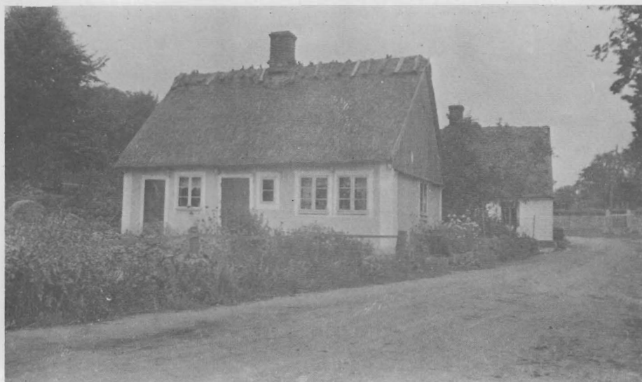
Gatehus nr 17, från söder, 1925.

Inga av bönderna på trakten hade någ-ra kontanta pengar. Man hade saker till husbehov och för övrigt betalade man i natura. Kanske »den stora kraschen» år 1895 kunde ge en förklaring till det egendomliga allmänna pekuniä-ra välstånd. Det var nämligen så, att man hade gjort tradition, att två gång-er varje år, då kom en kamrer från Brösarp, med vilken man höll »möte» på krogen, där man tog upp lån, gjorde växlar etc. Bönderna skrev på åt varandra och att få borgenärer var in-ga svårigheter, för hela Rörum var som en stor familj och att alla var mer eller mindre släkt med varandra. Den-na ekonomiska ställning blev så små-ningom ohållbar i byn. En växel kunde inte omsättas hur många gånger som helst! Och när en föll, drogs hela byn med i fallet, det var år 1895. De som klarade kraschen var lättträknade. De flesta fick gå ifrån sina hus eller blev indrivna på allt de ägde. Att den då-