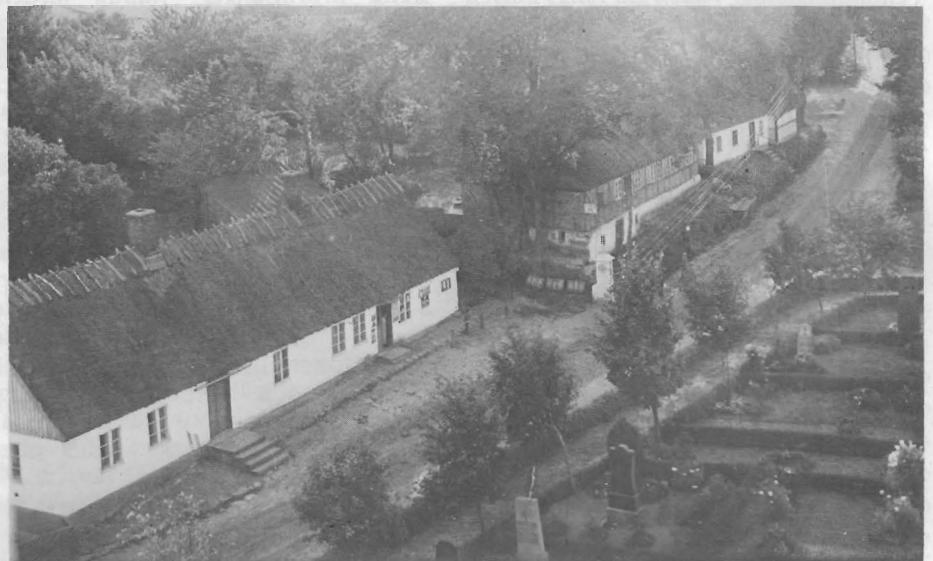
Det vänstra huset var den gamla gästgivaregården, 1927.

Under sin vistelse i Rörum (två dagar) antecknade han följande: »Rödsjukan, dysenteri, gick ännu i Rörum som, som förlidit år skövlade bort oändligt mycket folk i Skåne, besynerligen av allmogen,. Alla undrade, vad orsaken mände vara, att denna sjukdom på några år tillbaka blivit här så allmän. De mesta trodde, att inländska tobaken såsom mindre mogen än den utländska skulle kunnat förorsaka sjukdomen, emedan den isynnerhet yppat sig, sedan tobaksplantagen blivit allmänna ....»